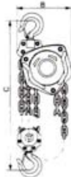
Su dviem grandinėm